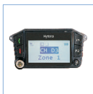
RCS-01 konsola bezprzewodowa