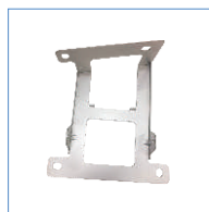
zestaw montażowy do radiotelefonu mobilnego*