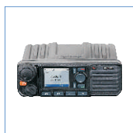
MD785(G) mobilny radiotelefon