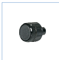
ADA-01 adapter bezprzewodowy