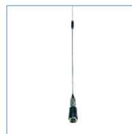
antena do radiotelefonu mobilnego

Powyższe ilustracje mają wyłącznie charakter informacyjny i mogą różnić się od rzeczywistych produktów.