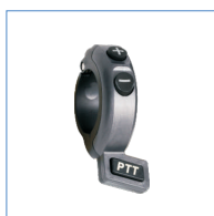
PTT na kierownicę (dostarczony z ramach RCS-01)