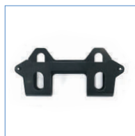
zestaw montażowy konsoli bezprzewodowej*