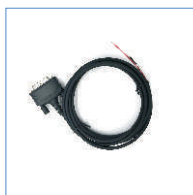
Pc60 przewód uruchomieniowy