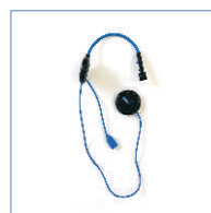
EWS01 bezprzewodowa słuchawka douszna wewnątrz kasku (z mikrofonem)